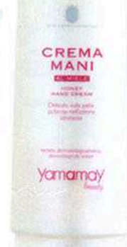
ΚΡΕΜΑ ΧΕΡΙΩΝ, CREMA MANI AL MIELE, YAMAMAY, €7,90, 210 6300166