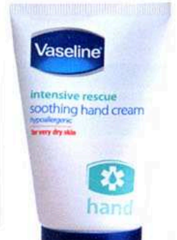
ΚΡΕΜΑ ΧΕΡΙΩΝ, INTENSIVE RESCUE SOOTHING HAND CREAM, VASELINE, €4,06, HONDOS CENTER, 210 5282800