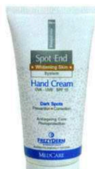
ΚΡΕΜΑ ΧΕΡΙΩΝ, SPOT END HAND CREAM, FREZYDERM, €19,83, ΣΤΑ ΦΑΡΜΑΚΕΙΑ.

Κατά τη διάρκεια του χειμώνα τα χέρια μας ταλαιπωρούνται περισσότερο από κάθε άλλο μέρος του σώματος και χρειάζονται εντατική περιποίηση. Διαλέξτε, λοιπόν, μία κρέμα και μην την αποχωριστείτε μέχρι την άνοιξη.